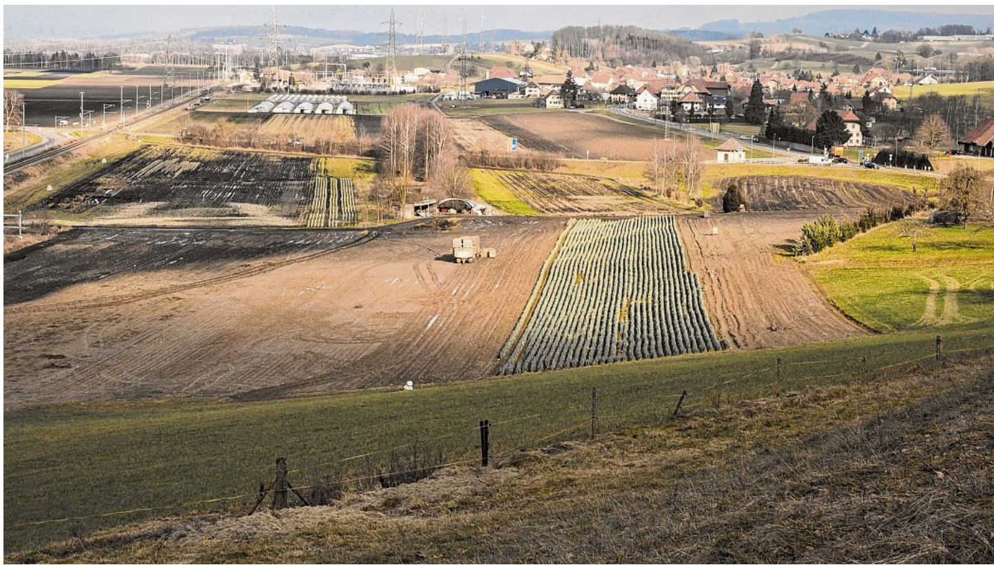
Strategische Arbeitszone Löwenberg: Hier sollen in den nächsten Jahren 1700 bis 3000 neue Arbeitsplätze entstehen.

MURTEN Die künftige Siedlungsentwicklung soll im Seebezirk hauptsächlich in den regionalen Zentren Courtepin, Gurmels, Kerzers, Murten und im Vully stattfinden. Dies geht aus dem Entwurf des regionalen Richtplans See hervor, der bis Ende März in der öffentlichen Vernehmlassung ist. Sowohl neuer Wohnraum als auch neue Arbeitsplätze sollen in den gut erschlossenen Zentrumsgemeinden mit guter Infrastruktur geschaffen werden. In der strategischen Zone Löwenberg sollen auf rund 60 Hektaren Fläche bis zu 3000 Arbeitsplätze entstehen. luk Bericht Seite 3